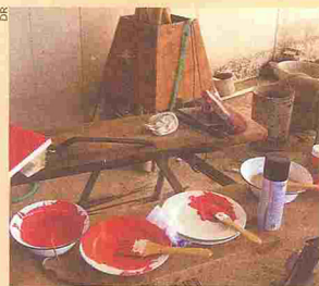
L'atelier chinois qui réalise les monochromes

Le jeune artiste suisse Raphaël Julliard (26 ans) a fait peindre en Chine par des ouvriers 1 000 monochromes rouges (comme le petit livre), tous identiques, de format 1 x 1 mètre, qui sont à