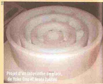
Projet d'un labyrinthe de glace, de Yoko Ono et Arata Isozaki