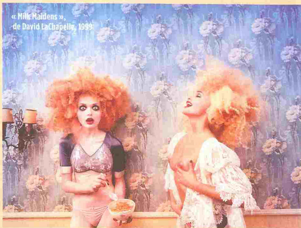
« Milk Maidens », de David LaChapelle, 1996

David LaChapelle, photographe américain de 36 ans, découvert par Andy Warhol, réalisateur de films, dont « Rize », sur l'univers du hip-hop, qui vient de sortir en salle... Le roi de l'image glamour futuriste, des femmes irréelles aux atours super-sexy, des portraits d'hommes aux expressions délirantes a aussi un excellent sens des affaires. Il exploite en galerie une partie de sa production faite pour les magazines ou les publicités. Ainsi, en 1996, il a imaginé ces « sœurs de lait » habillées en Galliano pour le magazine allemand Stern . Elles sont à vendre entre 6 000 et 20 000 euros, suivant le format, sur le stand de la galerie belge Maruani et Noirhomme.